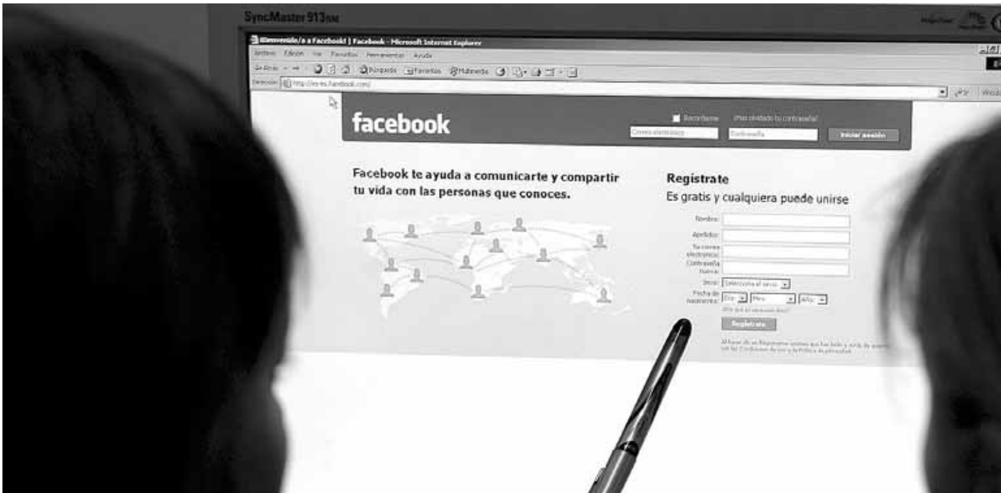
Dos jóvenes sentadas frente a la pantalla de un ordenador se disponen a crear un perfil de usuario en la red social Facebook.