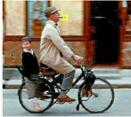
Cartel de Jacques Tati, con la pipa sustituida.