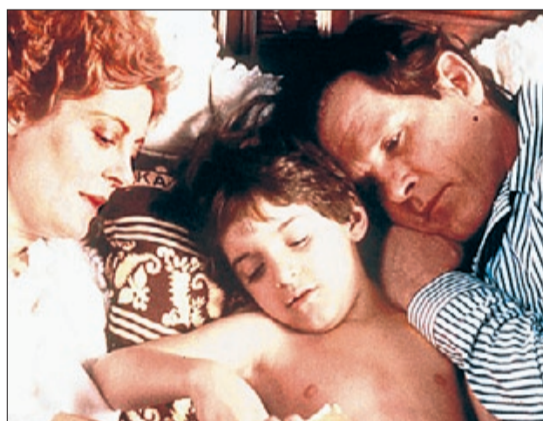
►► Un fotograma de la película 'Lorenzo's oil'.

misterio. «Van al colegio con normalidad», dice el jefe del equipo.