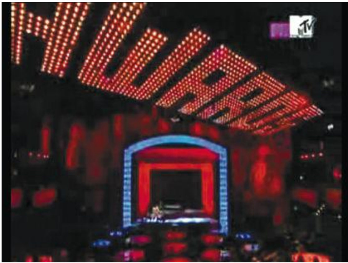
Vídeo de YouTube del programa de la gala de los premios MTV 2007.