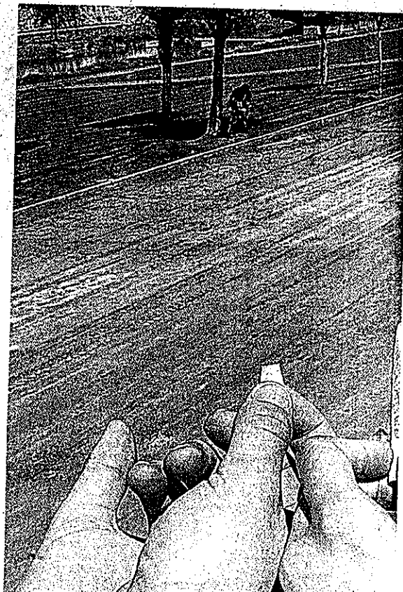
La marihuana se ha erigido en la droga ilegal más tolerada

■ La hora de la cosecha ha llegado y en las dependencias policiales el olor a marihuana ya se respira en el ambiente. Las plantas cuidadas con tanto esmero durante meses han alcanzado varios metros de altura, lo que las hace muy visibles. En un domicilio particular de la calle Girona de Lleida, la Guardia Urbana decomisó hace unos días tres plantas cuyas hojas se veían desde la calle ya que las macetas estaban en un balcón. Los agentes procedieron a su incautación e identificaron al dueño. En las últimas semanas los Mossos han realizado otras operaciones similares en poblaciones del Pirineo de Lleida y otros puntos de Catalunya. En casi todos los casos, los decomisos son de más de media docena de plantas y la marihuana ha crecido en huertos o parajes poco frecuentados.